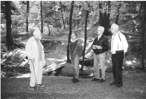
Exkursion im Fiedlergrund

Ich kann mir jetzt besser vorstellen, wie sehr Max Seurig unter den oft sehr unbefriedigenden Ergebnissen der gegenwärtigen Schulsysteme gelitten haben muss. Gelegentlich hört man auch von vorbildlichen Schulen, die auch Flüchtlingskinder erfolgreich mit einzubinden verstehen, wie die evangelische Gesamtschule Berlin-Mitte, bei der es zum Beispiel das Unterrichtsfach „Verantwortung“ gibt. Es wird viel experimentiert, auch mit jahrgangübergreifenden Klassen. Um Schulprobleme zu lösen, wurde kürzlich eine „Akademie für Potentialentfaltung“ gegründet. Ob das hilft? Vielleicht liegt es auch nur daran, dass hochbefähigte junge Menschen, wie Max Seurig sicher einer war, heute lieber in die Industrie gehen, wo sie um ein Vielfaches höher bezahlt werden. An dieser Stelle möchte ich erwähnen, dass eine Frau im Namen aller ehemaligen Schülerinnen und Schüler sich bei Max Seurig am Grabe bedankte, er sei der beste Lehrer gewesen, den sie je hatten.